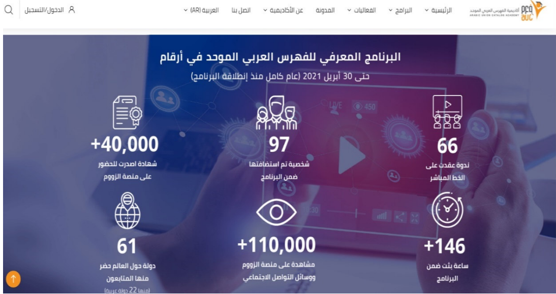
شكل (2) صورة توضح إحصائيات البرامج التدريبية الإلكترونية التي تقدمها منصة الفهرس

ويتضح من الشكل السابق المنشور على موقع المنصة إحصائيات البرامج التدريبية الإلكترونية التي قدمتها منصة الفهرس العربي الموحد، التي بلغت 66 فعالية إلكترونية بمثابة 146 ساعة بث مباشر للفعاليات. وفيها يلي عناوين بعض تلك البرامج التي قدمتها المنصة: